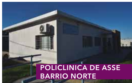
POLICLINICA DE ASSE BARRIO NORTE