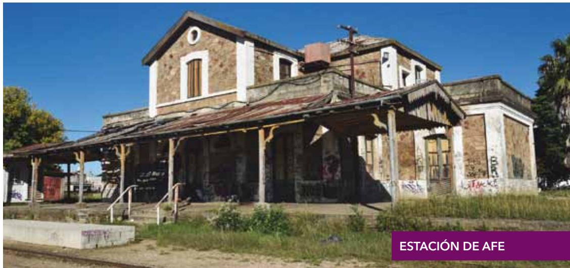
ESTACIÓN DE AFE