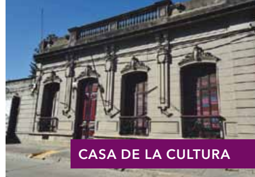
CASA DE LA CULTURA