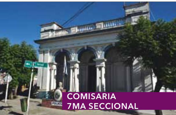
COMISARIA 7MA SECCIONAL