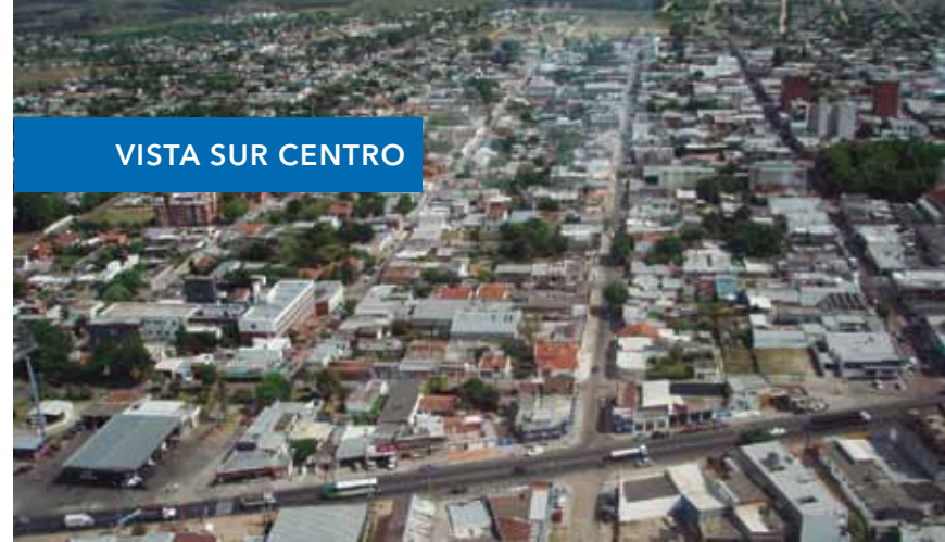
VISTA SUR CENTRO