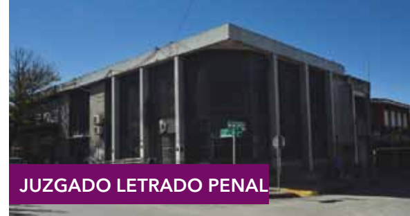
JUZGADO LETRADO PENAL