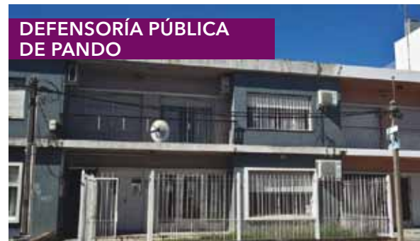
DEFENSORÍA PÚBLICA DE PANDO