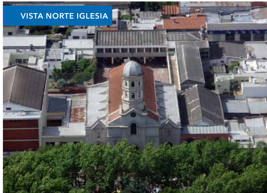
VISTA NORTE IGLESIA