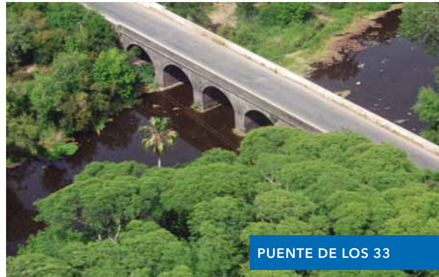
PUENTE DE LOS 33