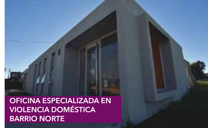
OFICINA ESPECIALIZADA EN VIOLENCIA DOMÉSTICA BARRIO NORTE