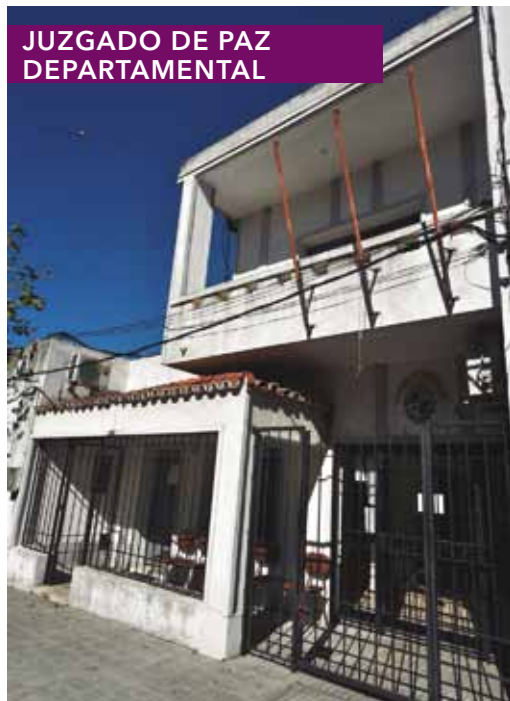
JUZGADO DE PAZ DEPARTAMENTAL