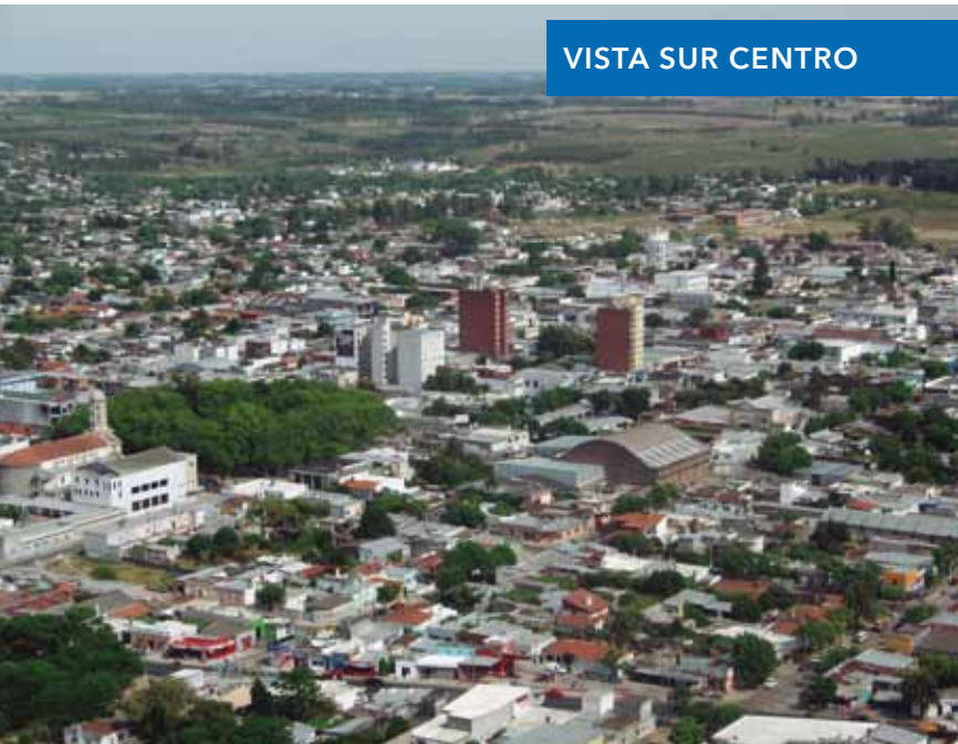
VISTA SUR CENTRO