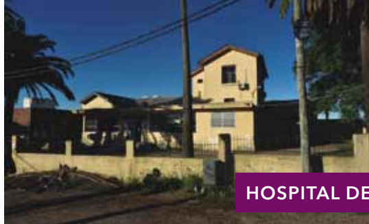
HOSPITAL DE PANDO