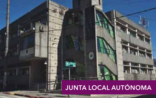
JUNTA LOCAL AUTÓNOMA