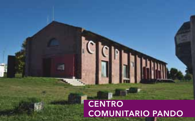
CENTRO COMUNITARIO PANDO