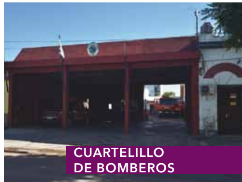
CUARTELILLO DE BOMBEROS