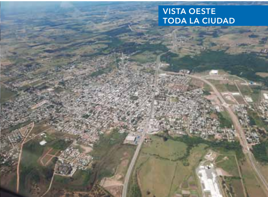
VISTA OESTE TODA LA CIUDAD