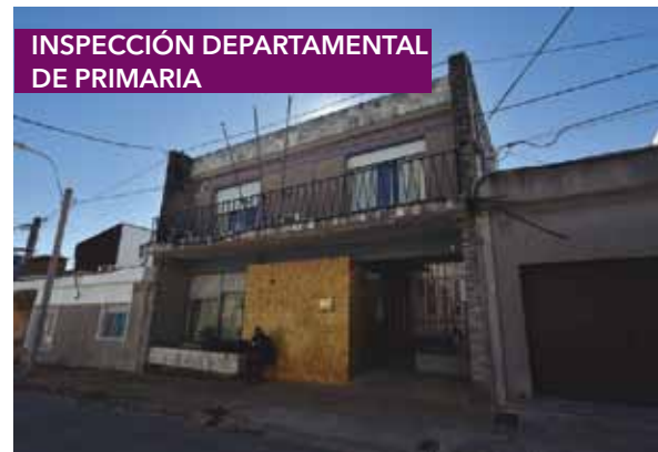
INSPECCIÓN DEPARTAMENTAL DE PRIMARIA