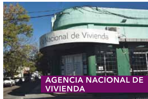
AGENCIA NACIONAL DE VIVIENDA