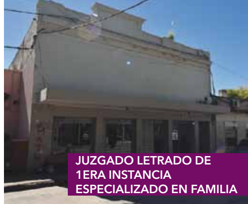
JUZGADO LETRADO DE 1ERA INSTANCIA ESPECIALIZADO EN FAMILIA