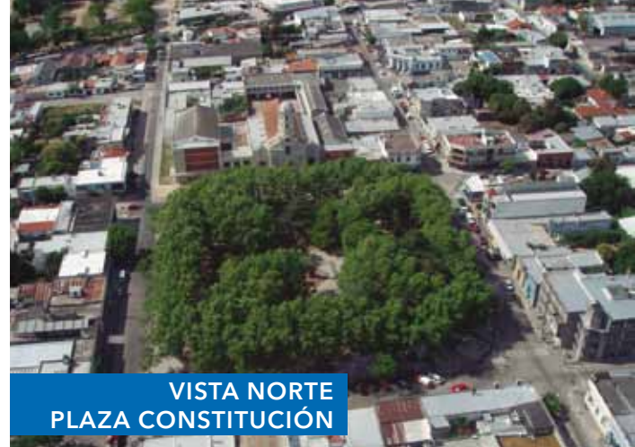
VISTA NORTE PLAZA CONSTITUCIÓN