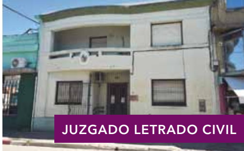
JUZGADO LETRADO CIVIL