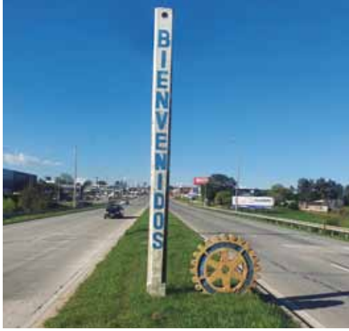
Entrada por Ruta 8 desde el Oeste