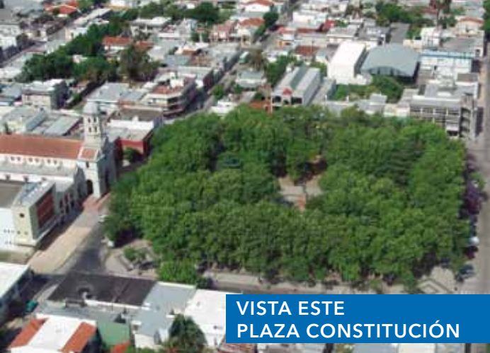
VISTA ESTE PLAZA CONSTITUCIÓN